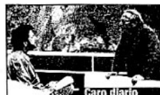
Caro Diario 1994 di Nanni Moretti