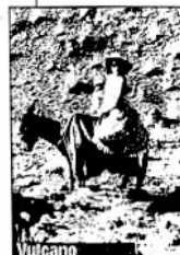
Vulcano 1950 di William Dieterle