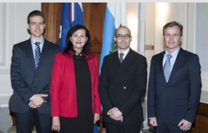
Sopra: Ministro Zafferani, Ministra Fierravanti-Wells, Ministro Renzi e Ambasciatore French Sotto: Ambasciatore French incontra i Capitani Reggenti a San Marino

Lo scorso 19 gennaio la Ministra per lo Sviluppo Internazionale e per il Pacifico, la Senatrice Concetta Fierravanti-Wells, ha visitato San Marino, per incontrare il Dott. Nicola Renzi, Segretario di Stato per gli Affari Esteri, il Ministro per il Commercio Andrea Zafferani, i Capitani Reggenti Marino Riccardi e Fabio Berardi, nonché i rappresentanti della Camera di Commercio di San Marino. La visita ha rafforzato la collaborazione tra Australia e San Marino , prima di tutto nell'ambito delle organizzazioni internazionali, dove l'Australia ha proposto candidati di alto profilo, in particolare presso le Nazioni Unite e al Consiglio per i Diritti Umani per il mandato 2018-2020 .